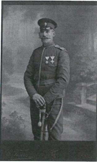
Луи Айер по време на Балканската война

На 2 септември 1916 г. при Доиран умира Луи Емил Айер, швейцарски и